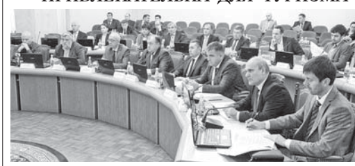
(Окончание. Начало на 1-й с.)

В республике единнадцать зон потенциальной рекреационной специализации: горно-рекреационный комплекс «Приэльбурье», санаторно-курортный комплекс «Нальчик», оздоровительно-лечебные комплексы «Джилы-Сла», «Аджигар», «Табубака».