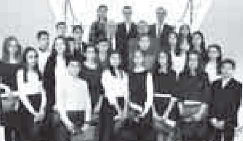
Основной документ, удостоверяющий личность гражданина РФ, получает каждый человек, достигший 14 лет. Бордовая книжечка напоминает об обязанности честно и добросовестно жить на благо Отечества.

Вчера в большом зале местной администрации г.о. Нальчик прошла гражданско-патриотическая акция «Я — гражданин России!». В этот день ребята получили главный документ — паспорт гражданина Российской Федерации.