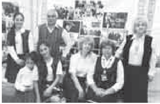
В составе культурного центра «Кодумаа» («Родина») — люди разных национальностей...