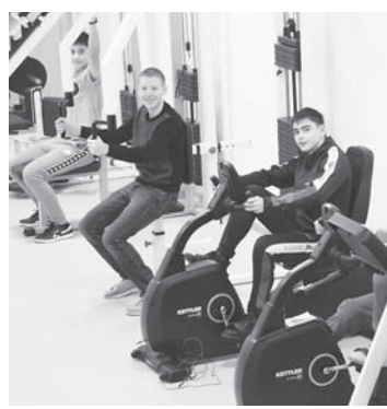
Врачи диспансера проводят обследование спортсменов.

Коллектив диспансера — это высококвалифицированные специалисты, прошедшие специальное обучение — установочный курс повышения квалификации и расширения своих профессиональных навыков, что необходимо для соответствия международным стандартам современной медицины. В работе используются единые стандарты качества лечения, строгий контроль медицинской помощи и сервиса, комплексное медицинское обслуживание, сотрудничество с профессиональными специалистами. Медицинскими работниками диспансера в 2019 году было обследовано 129 спортивных мероприятий российских, регионального и городского масштаба.