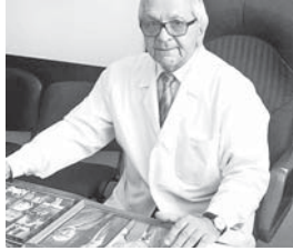
самим... По сути, это стало отправной точкой развития нейрохирургии.

«Время – понятие ёмкое и многогранное. Кроме всего прочего, это ещё и философская категория. Каждому отпущен свой срок. После человека на земле остаётся память, и какой она будет, зависит только от нас», говорил он в одном из последних интервью.