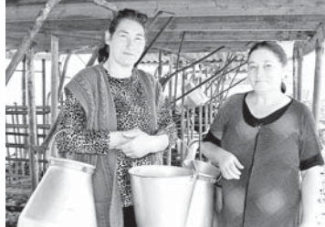
Сезон большого молока на землях отгонного животноводства

на 5,4%. Больше всего молока произведено сельскохозяйственными организациями Баксанского района – 10,6 тыс. тонн, на втором месте Чегемский район – 6,5 тыс. тонн, и третью позицию с показателем 5,7 тыс. тонн занимает животноводство Зольского района.