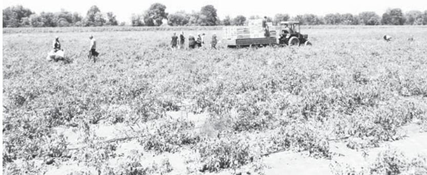
Начало сбора томатов открытого грунта в с. п. Псыкод