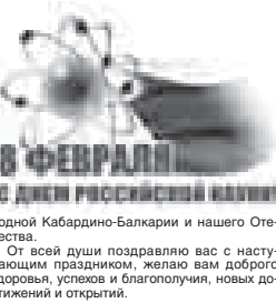
родной Кабардино-Балкарии и нашего Отечества. От всей души поздравляю вас с наступающим праздником, желаю вам доброго здоровья, успехов и благополучия, новых достижений и открытий.

Уважаемые деятели науки Кабардино-Балкарии! В феврале научная общественность страны отмечает свой профессиональный праздник – День российской науки. Кабардино-Балкария всегда гордилась талантливыми учёными, целеустремлёнными, высокообразованными людьми, которые вносили значимый вклад в развитие всех сфер жизнедеятельности республики. В современных условиях как никогда востребованы интеллектуальный труд, новейшие научные достижения, научные технологии, которые обеспечивают подъём, модернизацию и прогресс. От вас, вашего деятельного участия сегодня во многом зависит укрепление научного и технологического ресурса республики, формирование эффективной инновационной среды, а значит динамичное развитие экономики, рост благосостояния людей.